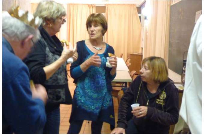
Le roi et sa cour