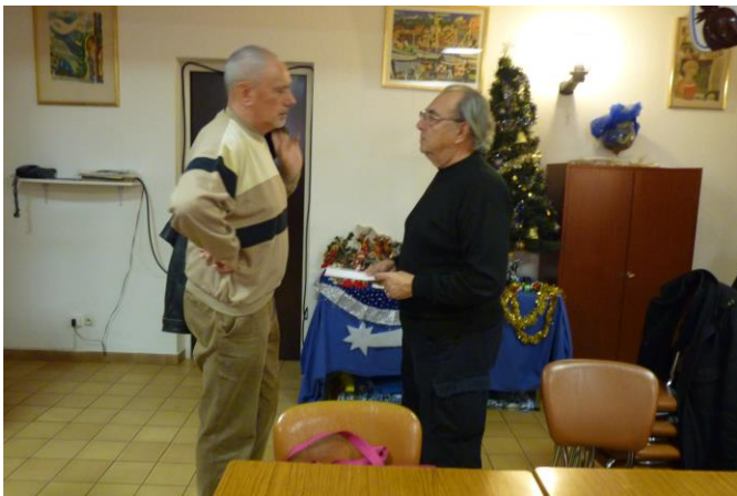
Les uns parlent pêche...