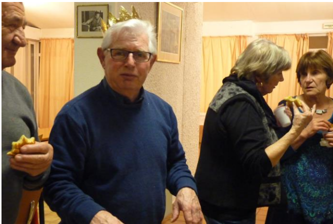
Et voici le roi Michel