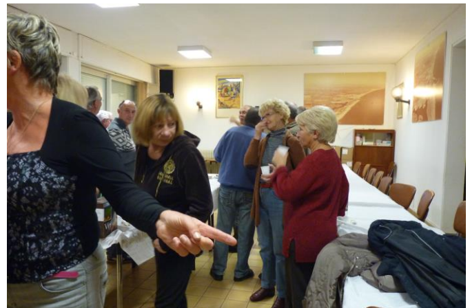
et les autres ?