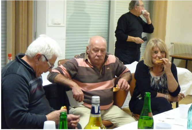
Oh ! les gourmands