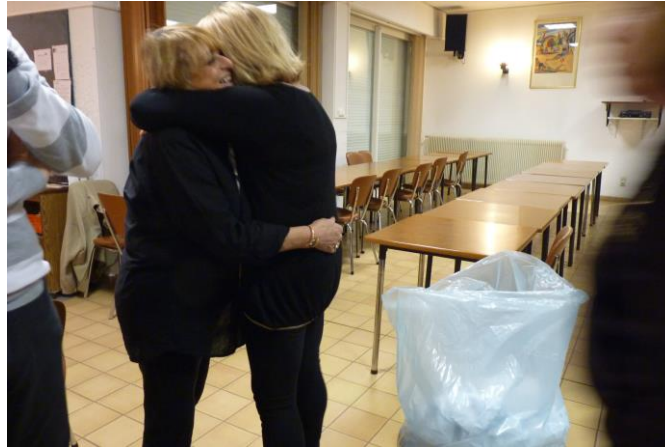
L'accolade de l'amitié