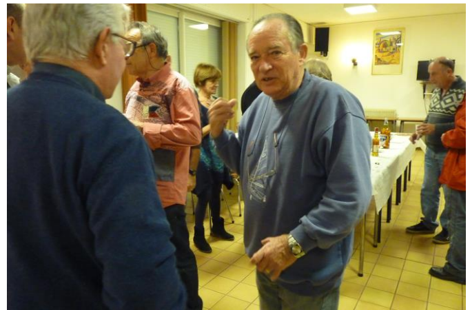
Discussion autour d'un apéritif dînatoire